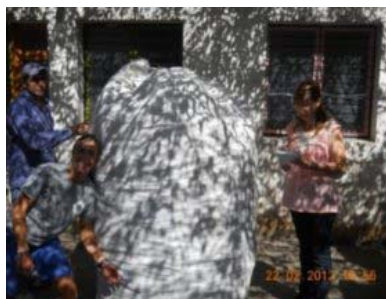
Jardín Changuito Dios 22/02