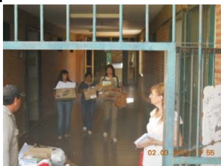
Esc. Ntra Sra de Lourdes 20/03