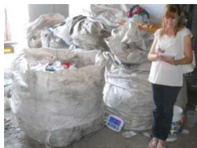
Esc. Especial ALPI 15/02