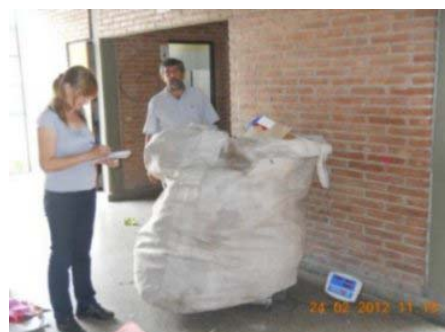
Jardin M.M. de Guem